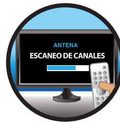
El escaneo de los canales es indispensable. Cualquier duda, escanear otra vez.