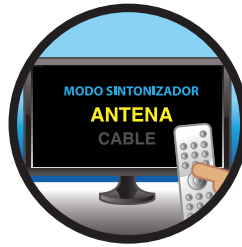
Fuente de entrada en modo antena