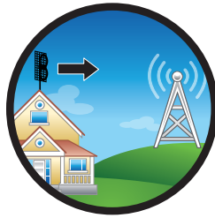
Apunte hacia las torres. La TDT está sujeta a la cobertura.